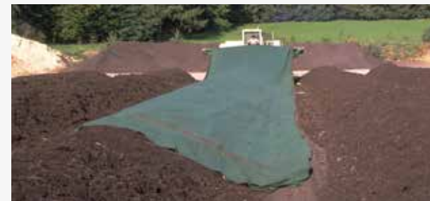
TenCate Toptex® használata az érett komposztra

Világszerte bizonyított, hogy a TenCate Toptex® komposzt védőtakaró hozzátartozik a mai modern komposztálási technológiához. Számos termelő alkalmazza ezt a terméket