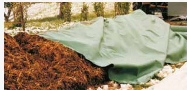
TenCate Toptex® használata nyers trágyára

Számos tapasztalt felhasználó alkalmazza a TenCate Toptex® komposzt takarót a legértékesebb termékekre: az érett komposztra! Ez egy gazdaságos megoldás könnyű kezelés. A szövet lehetővé teszi a gáz cserélődést, a nedvesség elleni védelemet, a komposztot szárazon tartja és morzsolékos struktúrát biztosít. Hatékonyan ellenáll a gyomképződésnek. Ez a megoldás egy hatékony és gazdaságos megoldás a komposzt kültéri tárolására.